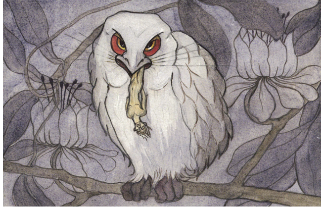
Marguerite Burnat-Provins: La vie, est-ce bon? , Ma Ville | ohne Datum Graphitstift, Aquarell auf Papier, 21,5 × 31,2 cm, Collection de l'Art Brut Lausanne

Realismus und Naturalismus (mit einem Hauch von Impressionismus) aus. Später wandte sie sich vermehrt symbolistischen Themen zu.