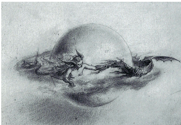
Fantasie und Studien | um 1890 Graphitstift auf Papier, 24,9 x 33,3 cm, Privatbesitz